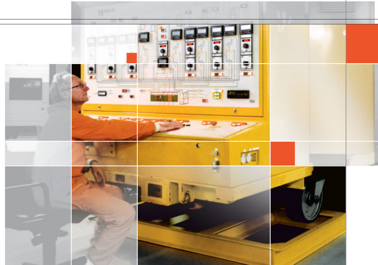
Fahrbare Anlage FAVORIT Transportable Facility FAVORIT